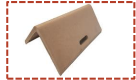
• Heavy-Duty (*)