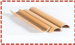
• C Profil